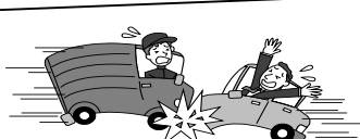
車で衝突してケガ