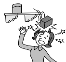
棚から物が落ちてケガ