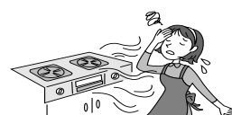
不完全燃焼してガス中毒