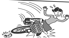
自転車で転倒してケガ